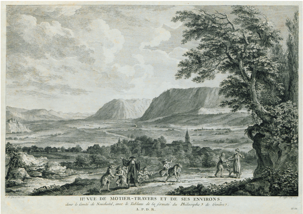
Figure 2: Pierre-Philippe Choffard d'après un dessin de Samuel Hieronymus Grimm, II e vue de Motier-Travers et de ses environs , 1777, eau-forte sur papier, 218 x 337 mm, Bibliothèque publique et universitaire de Neuchâtel, collection Hippolyte Buffenoir, Pa Rouss Buff 2/5.