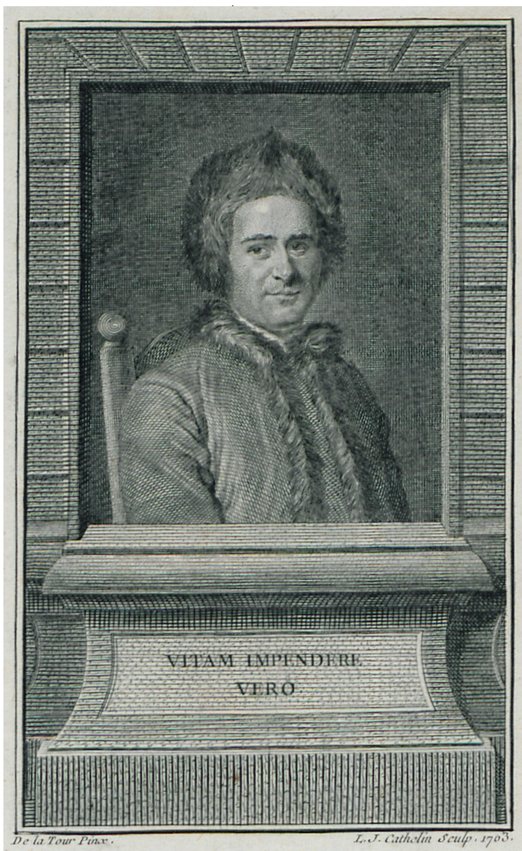
Figure 4 : Louis Jacques Cathelin d'après un pastel de Maurice Quentin de La Tour, Vitam impedere vero , 1763, burin sur papier, 124 x 77 mm, Bibliothèque publique et universitaire de Neuchâtel, collection Louis Perrier, RG 177.