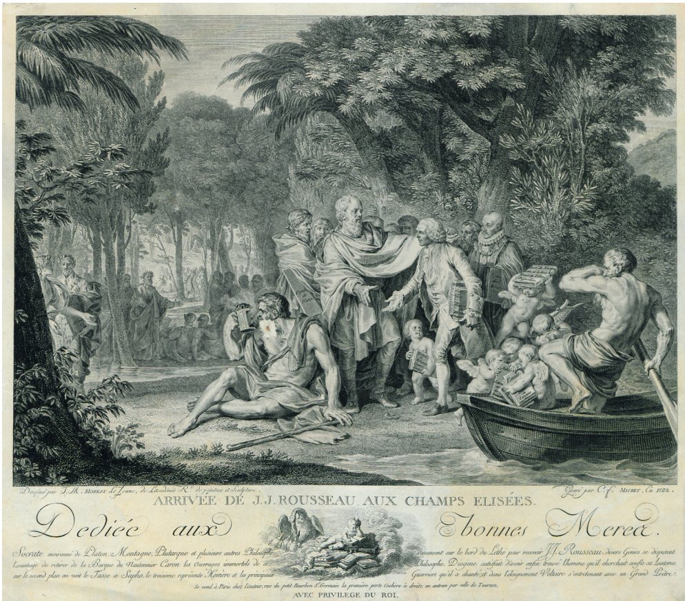
Figure 3 : Charles François Adrien Macret d'après un dessin de Jean Michel Moreau Le Jeune, Arrivée de J.J. Rousseau aux champs Elisées , 1789, eau-forte et burin sur papier, 232 x 330 mm, Bibliothèque publique et universitaire de Neuchâtel, collection Louis Perrier, RG 6.