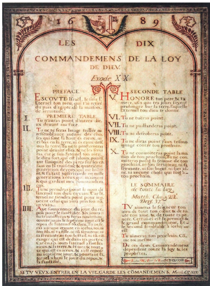
Jacobus N., Les dix commandements Fac-similé, Satigny, 1689 / XXI e siècle

© Musée international de la Réforme, Genève